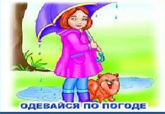
ОДЕВАЙСЯ ПО ПОГОДЕ