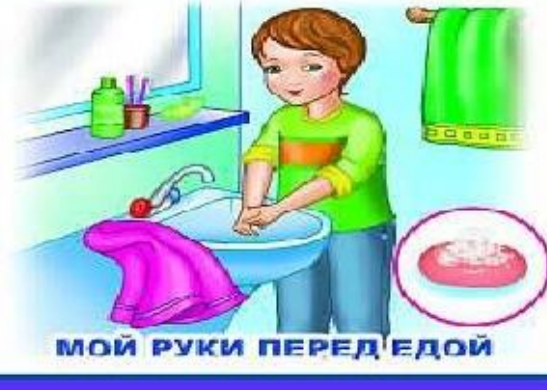
МОЙ РУКИ ПЕРЕД ЕДОЙ