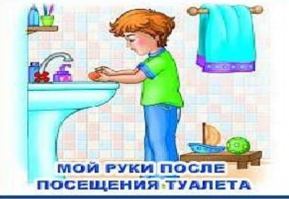
МОЙ РУКИ ПОСЛЕ ПОСЕЩЕНИЯ ТУАЛЕТА