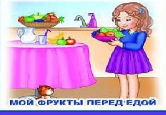
МОЙ ФРУКТЫ ПЕРЕД ЕДОЙ