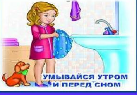
УМЫВАЙСЯ УТРОМ И ПЕРЕД СНОМ