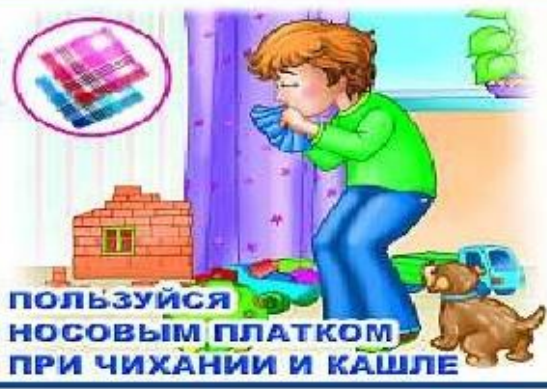
ПОЛЬЗУЙСЯ НОСОВЫМ ПЛАТКОМ ПРИ ЧИХАНИИ И КАШЛЕ