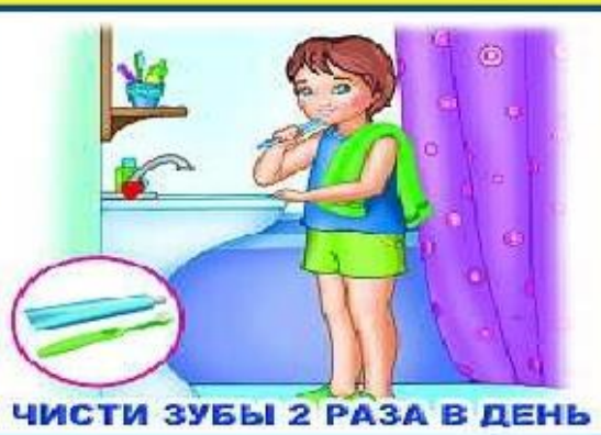
ЧИСТИ ЗУБЫ 2 РАЗА В ДЕНЬ