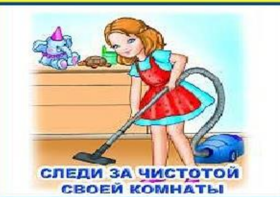
СЛЕДИ ЗА ЧИСТОТОЙ СВОЕЙ КОМНАТЫ