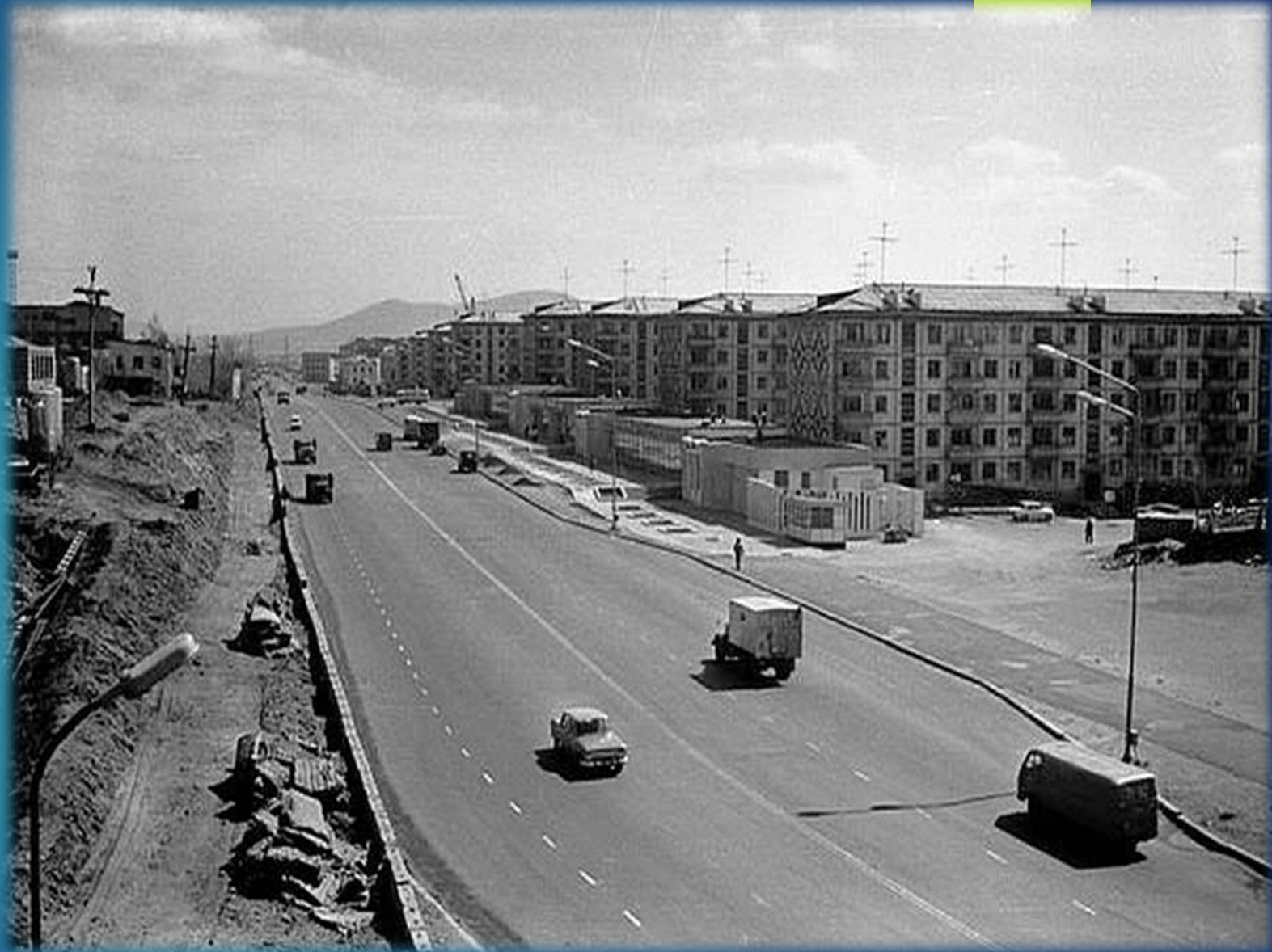
Улица имени В.Б. Борсоева