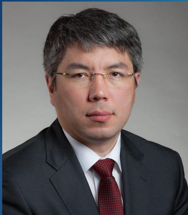
Глава Республики Бурятия – Председатель Правительства Республики Бурятия Цыденов Алексей Самбуевич