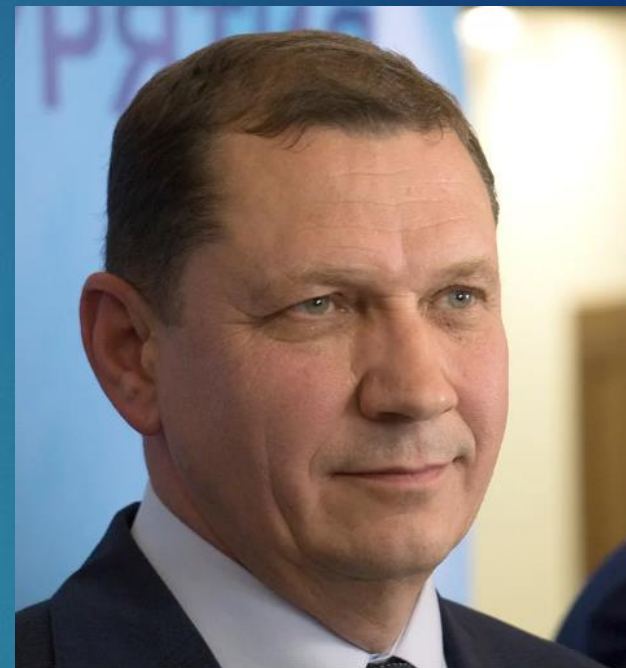
Шутенков Игорь Юрьевич – мэр города Улан-Удэ