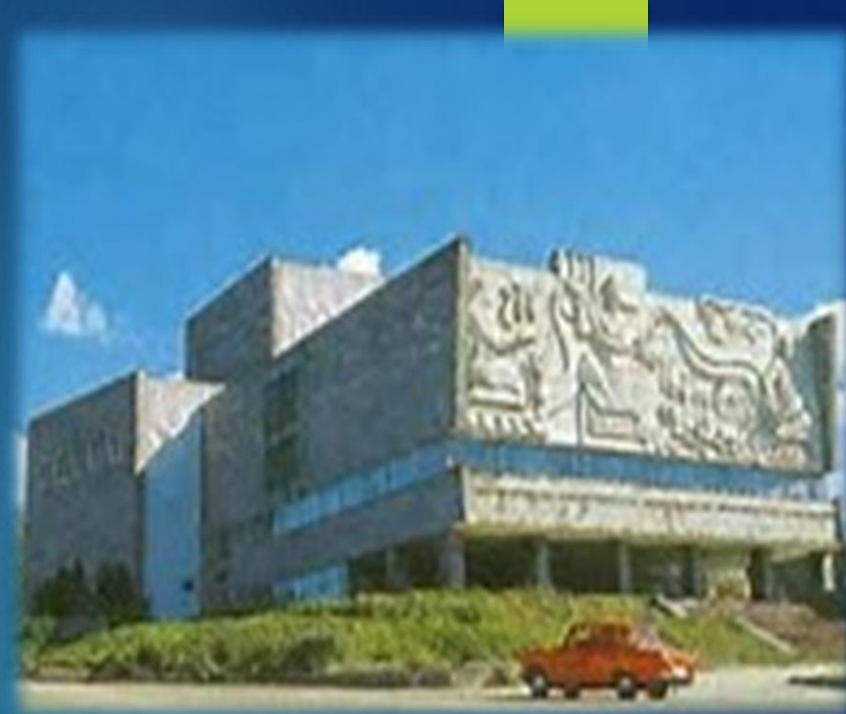
Бурятский академический театр драмы