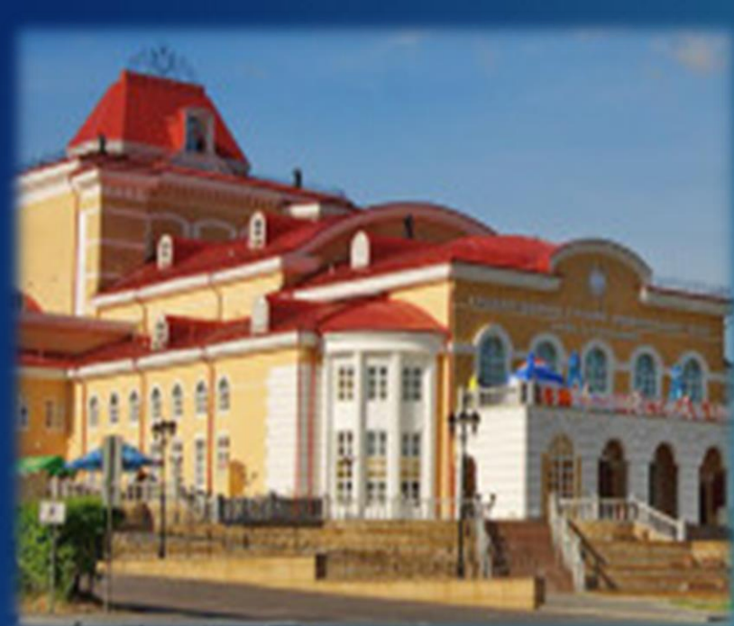
Русский драматический театр им. Н.А.Бестужева