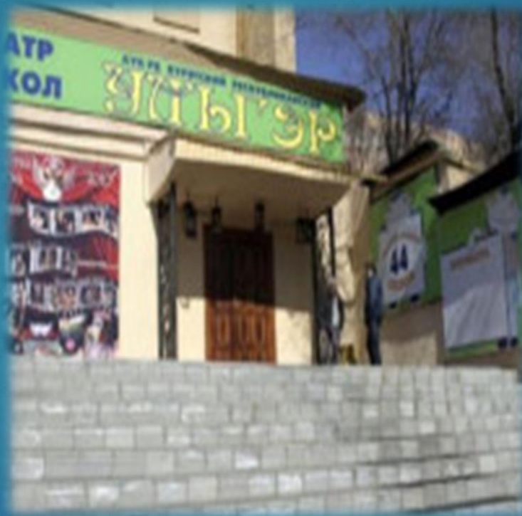
Кукольный театр «Ульгер»